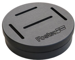
Porte-couteaux 8100 030